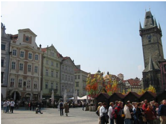
La grand'place (Slacestaromestske), avec son horloge astronomique.

Et sa statue hommage à Jean Huss, fondateur de l'hérésie hussite à l'époque de la Réforme.